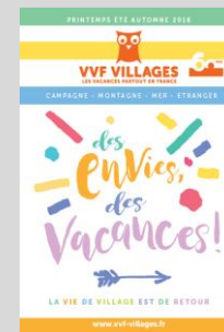
Brochure Printemps Eté Automne 2018