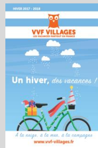
Brochure Hiver 2017/2018