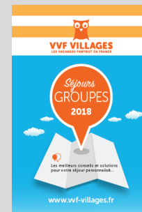
Brochure Groupes 2018